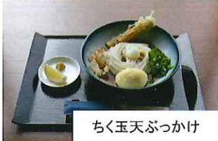
ちく玉天ぶっかけ

【営業時間】 11:30～14:30/17:30～20:00 【定休日】 月曜日(祝祭日は翌日)・第三火曜日 【住所】 丸山台3-1-6 2F