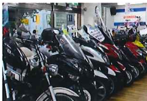
『YOU SHOP マルヤス港南』さんで購入、当店営業電動自転車マロンちゃん、元気です。